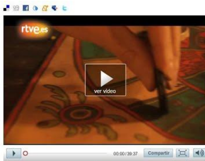
Crónicas - Siempre hacia el oeste

Os invito a que lo veáis con suma atención, para sacarle el máximo partido a lo que hemos visto y oído.