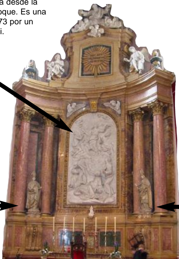
Bajo el relieve principal hay una preciosa imagen de la Inmaculada Concepción denominada Virgen del Patrocinio .